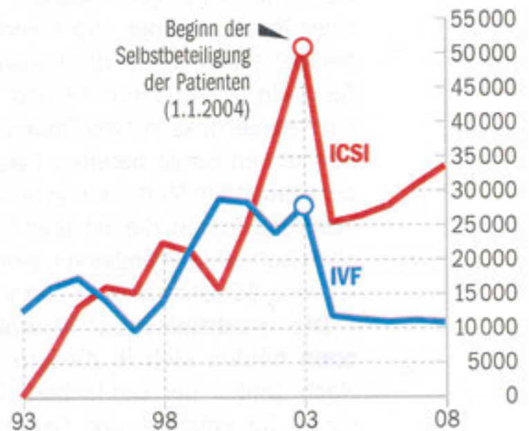
Anzahl der Eizellentnahmen

Gewinnkurve Die teurere Spermieninjektion ICSI läuft der klassischen In vitro-Fertilisation (IVF) den Rang ab